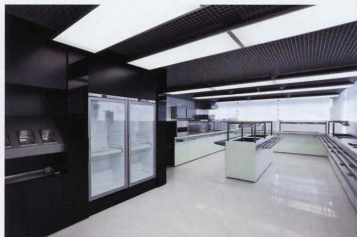
3 Výdejní část.

en— This interior, built within an existing functioning structure, takes advantage of the generosity of the two-story space within which it is located. Its concept is based on simplicity and austerity, as is reflected in its color, and spatial material solutions. The space is divided into three colored zones. The lower floor, completed in shades of black and white and complimented with green accents, is designated for food pick-up and consumption. The upper gallery, with a cafe style seating arrangement, is lined with dark brown facing tiles. A lime green cube shaped lounge is located on the second floor above the pick-up area. The entire area is lit by suspended linear fixtures, some of which illuminate the green cube with spot lights their luminosity progressing through to the lounge.