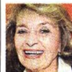
Yveta Simonová zpěvačka

Nazpívala přes osm set písní, mimo jiné je její hlas spojen s písněmi z filmu Limonádový Joe, třikrát získala druhou cenu v soutěži Zlatý slavík, vystupovala v televizi i v rozhlasu. Právě dnes slaví osmdesát let. A její kariéra začala v Karlíně.